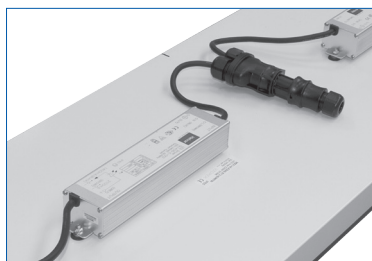
KONEKTOR / CONECTOR IP65