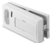
Obr 2. Zavírání