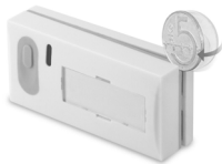
Obr 1. Otvírání